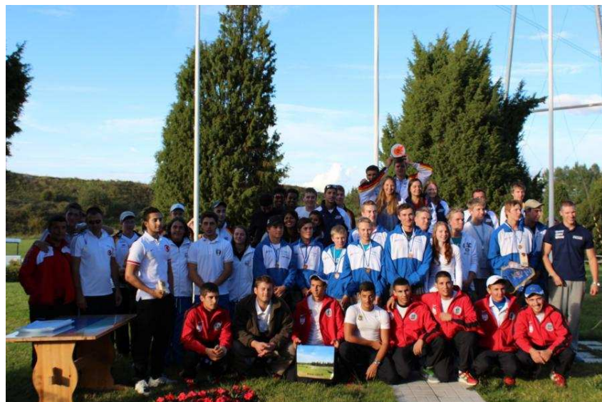
International Junior Shotgun Cupiin osallistuvia ryhmäkuvassa sunnuntain palkintojen jaon jälkeen