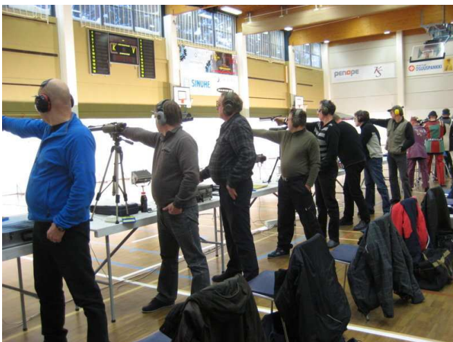
Ilma-aseiden Kinkkukisa järjestettiin urheilutalon palloiluhallissa joulukuussa.