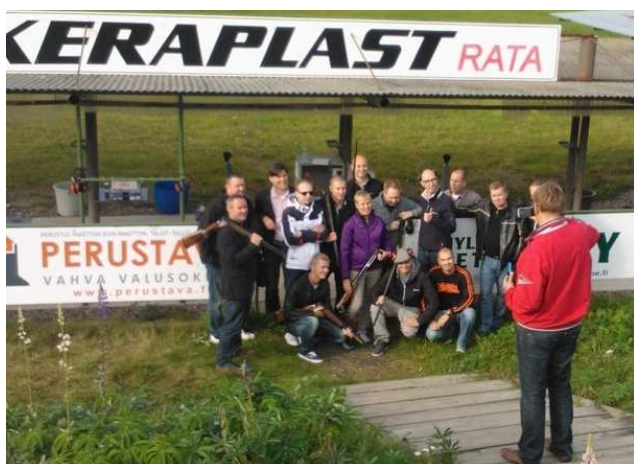
Elisan ja Nokian henkilökuntaa tutustui haulikkoammuntaan.