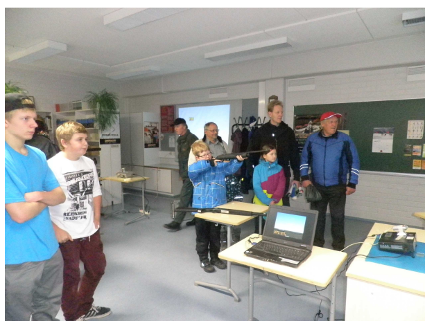
Uudenmaan erätulilla esiteltiin ammuntaa haulikkosimulaattorin avulla.