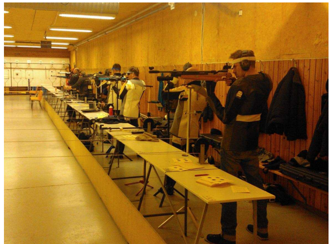
Seuran mestaruudet ammuttiin vuoden aikana, vuorossa ilmakivääri.