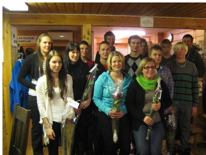
Kauden päättäjäisissä palkittiin vuoden 2012 SM-mitalisteja